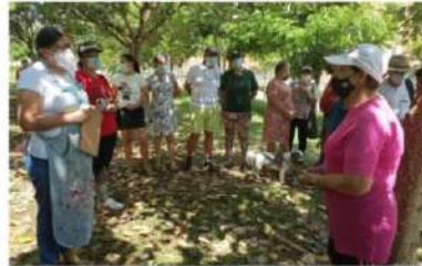
El río Opía, un afluente por cuidar