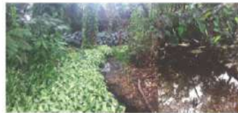
Reconocimiento y limpieza en el nacimiento del río Opía

Facultad de Humanidades, Artes y Ciencias Sociales