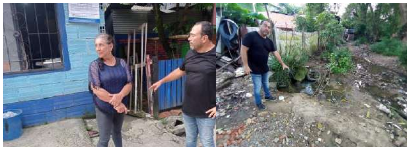
Img. Visita del ingeniero civil en presencia de la presidenta de la junta de acción comunal .