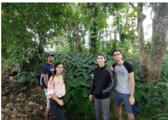
Img. Visita estudiantes del semillero de Patrimonio Cultural