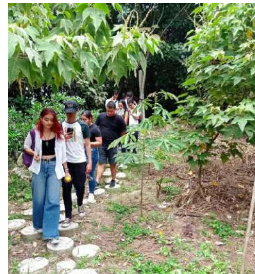
Img. Trabajo de losetas sendero rio Opia