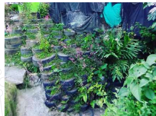
Img. Muro de protección erosivo en el barrio del Tesoro