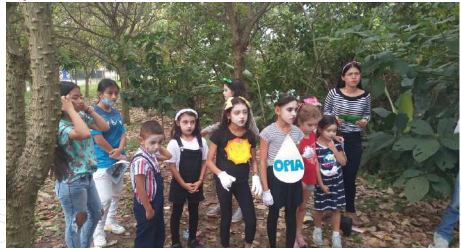
Img. Festival del río Opía.